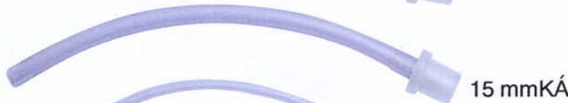
Szívókatéter, közepes méretű Ch. 28, Kat.szám: 30-57-609