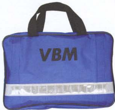
Hordtáska a kézi szívó, tartályok és katéterek számára Katalógusszáma: 30-64-000