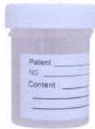
50 ml-es váladéktartály gyermekeknek, zárókupakkal Kat.szám: 30-56-050