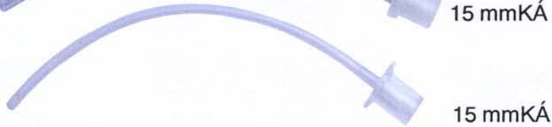
Szívókatéter, kis méretű Ch. 14, Kat.szám: 30-57-305