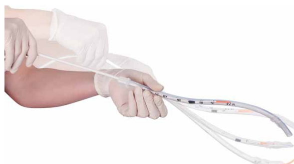
2. ábra: Ezzel a tubusvég térbeli táncoló mozgását érzjük el

Alaktartóan hajlítható tubusvezetők vagy bougie-k használata az orotrachealis intubáció során a nehéz-légút kezelési algoritmusok szerves részét képezik. Használatuk a rutin intubáció során is egyre gyakoribb, összefüggésben a videolaringoszkópia fejlődésével és terjedésével. Az orotrachealis tubus distalis végének manőverezhetősége szükséges lehet a hangrésen keresztül a légcsőbe történő behatolás során.